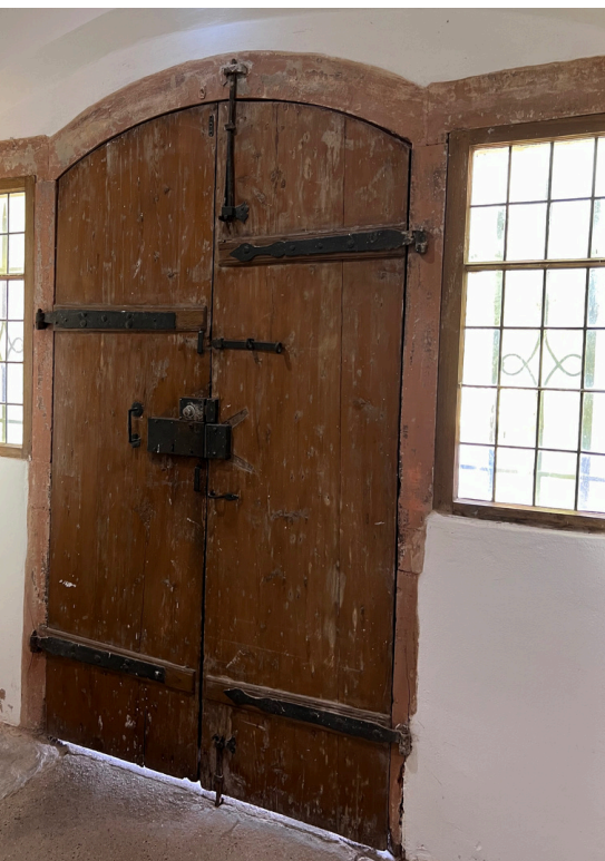
détail de la porte du 17e siècle donnant accès à la Chapelle